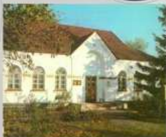
Великі Сорочинці. Будинок музею письменника М.В.Гоголя

Микола Васильович Гоголь народився 1 квітня 1809 року в селі родовому маєтку Гоголів. Зараз село, де раніше жили Гоголі, називається Гоголеве, але дім митця стоїть на тому ж самому місці, відбудований за малюнками й кресленнями самого письменника.