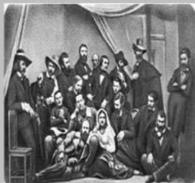
М.В. Гоголь з російськими художниками в Римі. 1845 р.